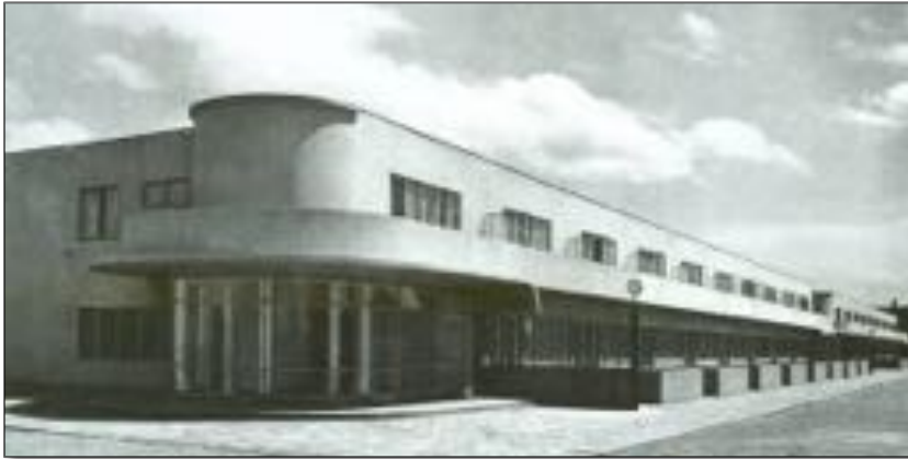
Hoekse Stijl anno 1927

Wonen in Hoek van Holland is bijzonder! Mede door de ligging aan Waterweg en spoorlijn, en het rijke Hoekse verleden. In het jaar waarin de voor HvH zo belangrijke Hoekse Lijn een metamorfose ondergaat, stonden onze activiteiten in het teken van de kunst van het wonen. En passant namen we ook het eeuwfeest van De Stijl mee. We gingen op zoek naar de typisch Hoekse Stijl in de woningbouw met op den duur een focus op de Oud-woningen aan de Tweede Scheepvaartstraat (beeldbepalende locatie, thema dorp).